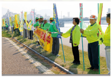
街頭での安全広報