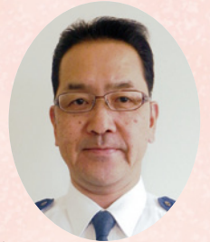
高速道路交通警察隊長