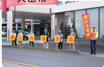
交通安全啓発活動