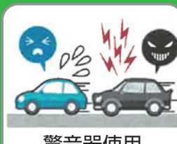
警音器使用 制限違反