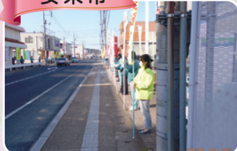
交通安全啓発活動