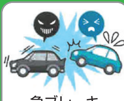
急ブレーキ 禁止違反