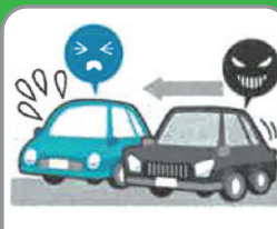
安全運転義務違反