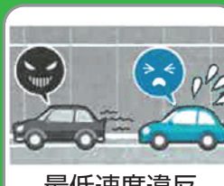
最低速度違反 （高速自動車国道）