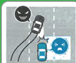
進路変更禁止違反