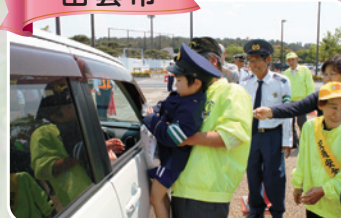
安全運転の呼びかけ