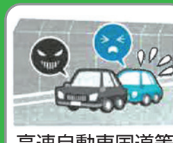
高速自動車国道等 駐停車違反