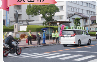
交通安全啓発活動