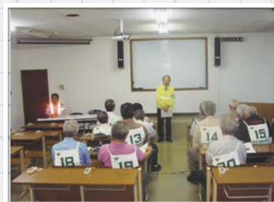
→ 高齢者の交通教室

～あなたの会費が交通安全のボランティアの活動を支えています～ 交通安全協会への加入をお願いします。