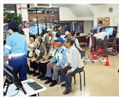
高齢者の交通教室