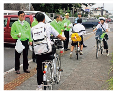
自転車の街頭指導