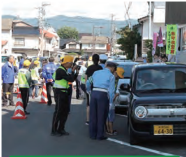
街頭での安全広報