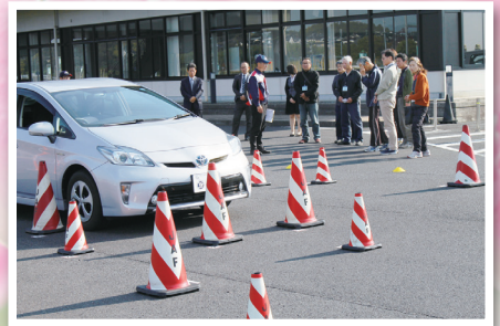
ドライビングスクール