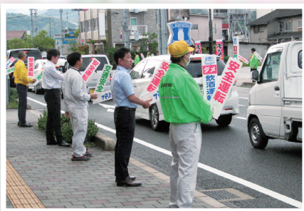
街頭での安全広報