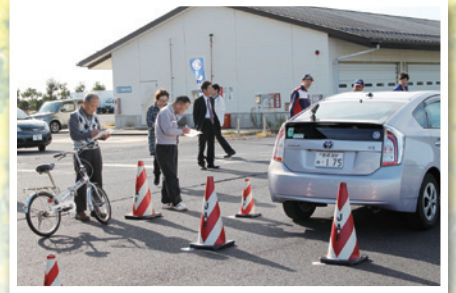
ドライビングスクール