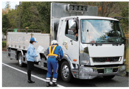
運転者への安全広報