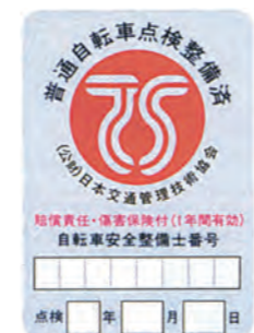
TSマーク（赤色マーク）