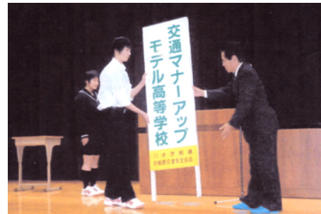
マナーアップモデル校看板の交付