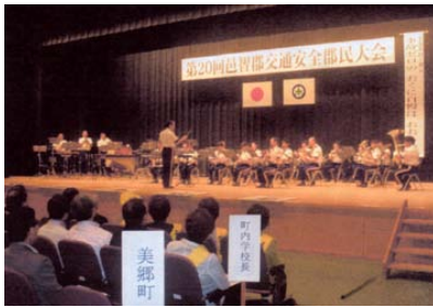
警察音楽隊による演奏

続いて交通課員と役場職員が夜光反射材着用を呼びかける啓発イベント、地芝居星ヶ丘一座が飲酒運転根絶を訴える、笑いを交えながらの寸劇を行い、郡民の交通安全意識の高揚を図りました。