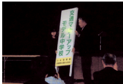
マナーアップモデル校看板の交付