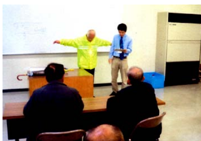
夜光反射材の実践教養