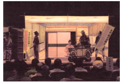
星ヶ丘一座の寸劇