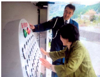
身体能力診断の状況

そのほか、DVDの視聴や、運転適性診断機器を使用した運転能力、歩行能力、周辺視野などの適性診断に挑戦していただき、自身の身体能力の注意点について学んでいただきました。