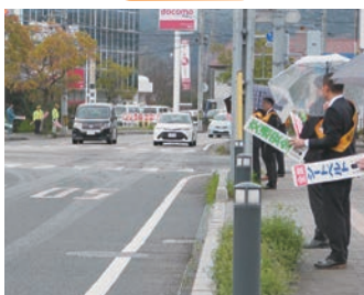
交差点での啓発活動