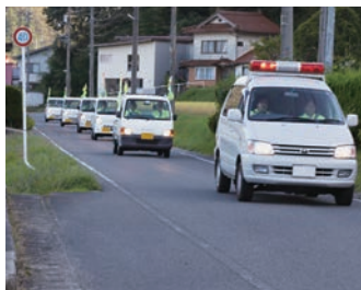
軽トラックパレードによる広報