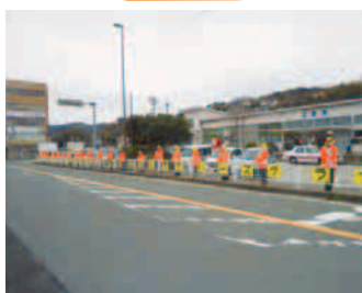
駅前での広報活動