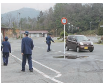
ドライビングスクール