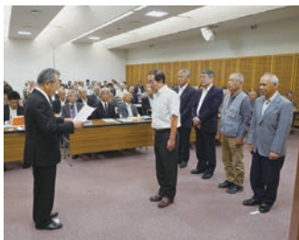
飲酒運転根絶施策優良地区の表彰