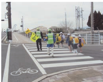
通学路での見守り活動