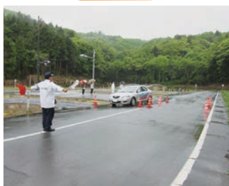
ドライビングスクール