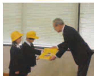
新1年生への安全グッズ配布