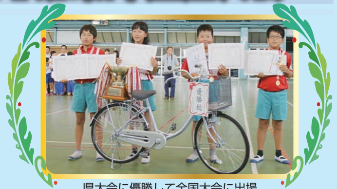
県大会に優勝して全国大会に出場

8月9日(水)東京ビッグサイトにおいて第52回交通安全子供自転車全国大会が開催されました。この大会には全国の都道府県代表47チーム(188名)の児童が集まり、学科試験・技能試験に挑戦しました。本県からは県大会で優勝を果たした松江市立竹矢小学校チームが出場し第28位と健闘しました。