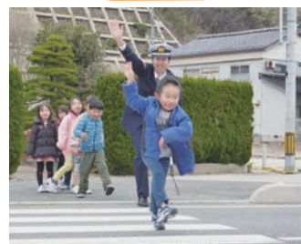
新入生の交通教室