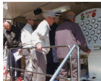
シルバーフェスタ