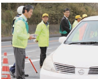
ドライバーへの広報活動