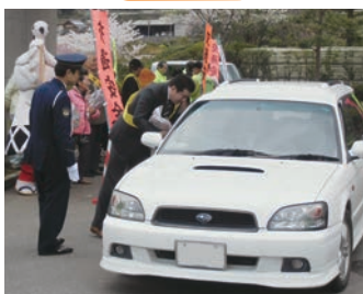
ドライバーへの広報活動