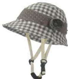
品番C622: ¥9,240税込 (シエル+アウター・セット価格) 品番C322: ¥4,620税込 (アウターのみ) SIZE: S M L