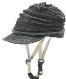
品番C840: ¥8,580税込 (シエル+アウター・セット価格) 品番C440: ¥4,180税込 (アウターのみ) SIZE: S M L