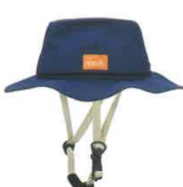
品番C831: ¥8,580税込 (シエル+アウター・セット価格) 品番C431: ¥4,180税込 (アウターのみ) SIZE: S M L