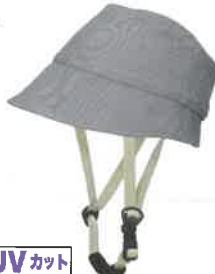
UVカット 品番C624: ¥9,240税込 (シエル+アウター・セット価格) 品番C324: ¥4,620税込 (アウターのみ) SIZE: S M