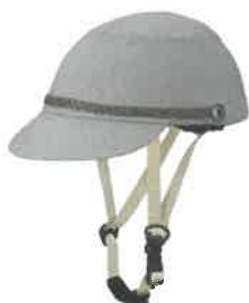
品番C631: ¥9,020税込 (シエル+アウター・セット価格) 品番C331: ¥4,400税込 (アウターのみ) SIZE: S M