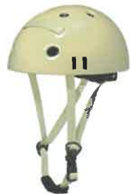
品番C101: ¥4,950税込 (シエルのみ) SIZE: S M L