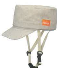
品番C801: ¥8,580税込 (シエル+アウター・セット価格) 品番C401: ¥4,180税込 (アウターのみ) SIZE: S M L