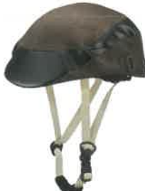
品番C642: ¥9,240税込 (シエル+アウター・セット価格) 品番C342: ¥4,620税込 (アウターのみ) SIZE: S M