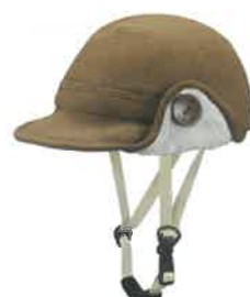
品番C641: ¥9,240税込 (シエル+アウター・セット価格) 品番C341: ¥4,620税込 (アウターのみ) SIZE: S M