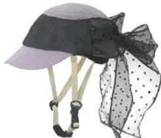
品番C620: ¥9,240税込 (シエル+アウター・セット価格) 品番C320: ¥4,620税込 (アウターのみ) SIZE: S M