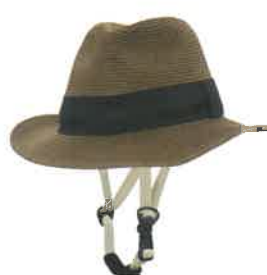
品番C810-DR: ¥8,580税込 (シエル+アウター・セット価格) 品番C410: ¥4,180税込 (アウターのみ) SIZE: M