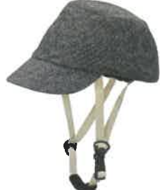
品番C605: ¥9,020税込 (シエル+アウター・セット価格) 品番C305: ¥4,400税込 (アウターのみ) SIZE: S M L