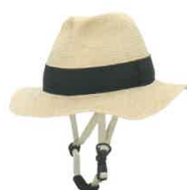
品番C810-GS: ¥8,580税込 (シエル+アウター・セット価格) 品番C410: ¥4,180税込 (アウターのみ) SIZE: M