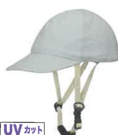
UVカット 品番C634: ¥9,020税込 (シエル+アウター・セット価格) 品番C334: ¥4,400税込 (アウターのみ) SIZE: S M