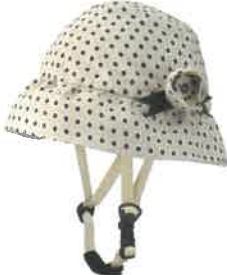
品番C621: ¥9,240税込 (シエル+アウター・セット価格) 品番C321: ¥4,620税込 (アウターのみ) SIZE: S M