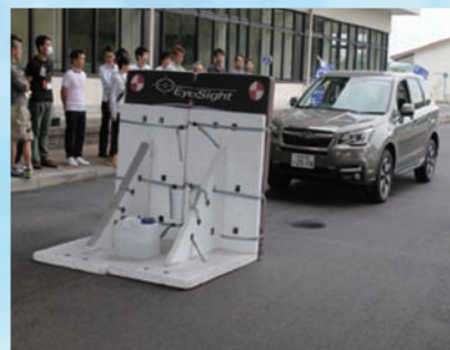
ドライビングスクール