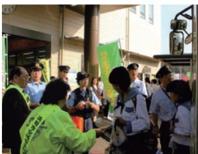
街頭での安全広報