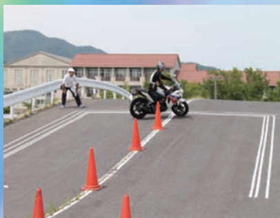
二輪車安全運転大会