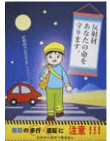
島根デザイン専門学校 梶谷 大樹