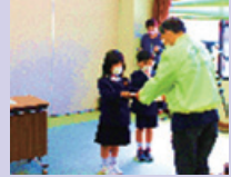
ランドセルカバーの贈呈