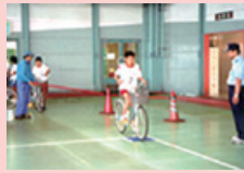
子供自転車安全運転大会