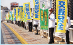
街頭での交通安全呼びかけ