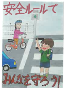
小学生高学年の部