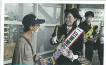
一日警察署長の委嘱