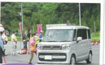
交通安全テント村の開設