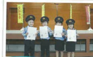
チビッコお巡りさんの委嘱式