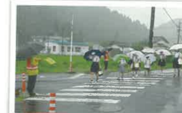
登校時の見守り活動