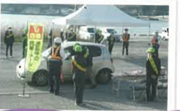
交通安全テント村の開設