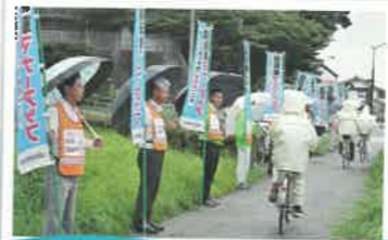
自転車マナーアップ街頭活動