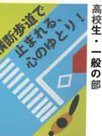
高校生・一般の部