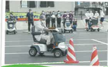
電動三輪車の講習会