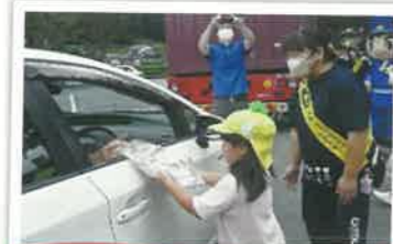
交通安全テント村の開設