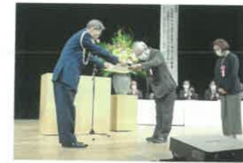
島根県警察本部長連名表彰等の贈呈