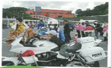
白バイ・恵比寿さんも一役