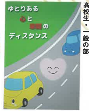
高校生・一般の部