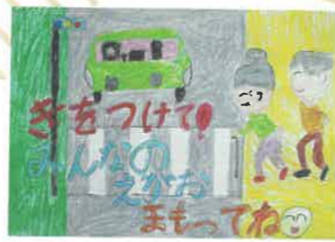
小学生低学年の部