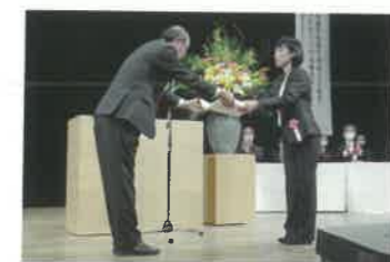
島根県交通安全協会会長表彰等の贈呈