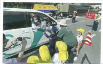
交通安全テント村の開設